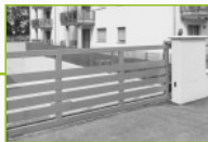
Automatyka do bram