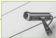
Systemy alarmowe i monitoringu