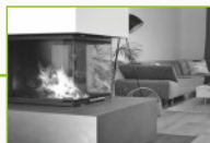
Kominki z płaszczem wodnym