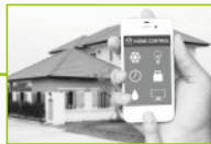
Systemy inteligentnego domu