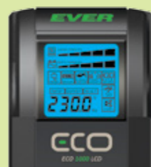
ROZBUDOWANY PANEL LCD (EVS)

LISTWA ANTYPRZEPĘCIOWA (Zaawansowana): ✓ STANDARD ✓ STANDARD IEC ✓ INTERNET ✓ STANDARD Plus ✓ KOMFORT ✓ PREMIUM / PREMIUM Plus ✓ VOYAGER ✓ OFFICE